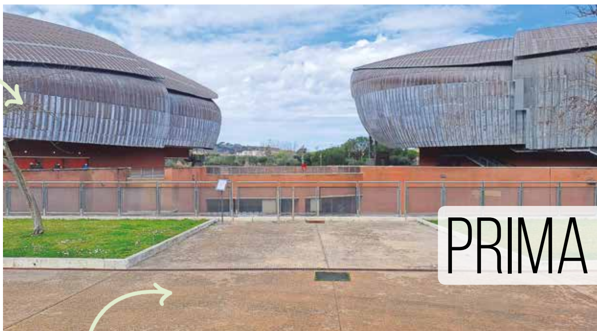
Pavimentazione in cemento molto funzionale, ma non adatta all'installazione.

Schermare il vuoto centrale e mettere in risalto le due cupole laterali dell'Auditorium di Renzo Piano.